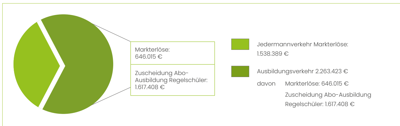
Grafik: Verkehrserlöse im Jahr 2022

Neben den Fahrgeldeinnahmen umfassen die Verkehrserlöse auch Erstattungsleistungen für die unentgeltliche Beförderung Schwerbehinderter nach § 228 SGB IX. Der Erstattungssatz wird jährlich neu festgelegt; er beträgt für das Abrechnungsjahr 2022 2,70 % der nachgewiesenen Bruttofahrgeldeinnahmen. Im Rahmen der verbundweiten Einnahmeverteilung (RMV-EAV) erfolgt eine Verrechnung der verkauften Fahrausweise nach deren Nutzung. Im Saldo ist ein Fremdnutzerausgleich abzuführen, der im Bereich der OREG im Jahr 2021 bei ca. 15 % der erzielten Bruttofahrgeldeinnahmen lag.