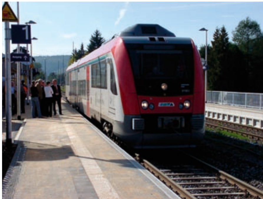
Premierenhalt: Erstmals hält ein „Itino“ am neuen Bahnsteig 1 in Bad König

Ende Oktober kommen Fahrgäste in den Genuss einer modernen Bahnstation