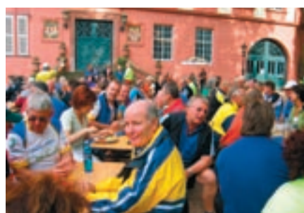
Geselliger Tour-Abschluss in Erbach

Von Erbach ging es am ersten Tag über das Sensbachtal hinauf nach Walldürn. Nach einer erholsamen Nacht im Odenwälder Wallfahrtsort radelten die rund 200 Teilnehmer am nächsten Morgen weiter nach Obernburg. Die Schlussetappe führte die Biker schließlich am dritten Tag zur großen Abschlussparty im Schlosshof in die Kreisstadt Erbach. Trotz einiger Pannen und kleinerer Blessuren war die Stimmung im Fahrerfeld durchweg sehr positiv. Daran konnte auch das trübe