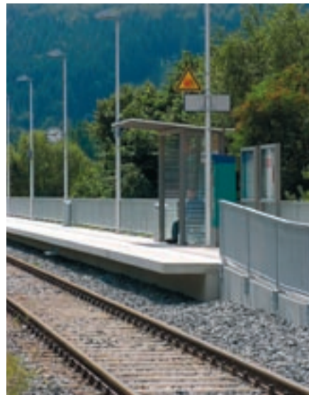
Der neue Bahnsteig in Bad König-Zell bietet Reisenden auf der neuen Odenwald-Bahn deut-lich mehr Komfort beim Ein- und Ausstieg.

Zu Erreichen ist die Frankfurter Buchmesse schnell und einfach mit der neuen Oden-wald-Bahn. Das Kombiticket, bestehend aus Messe-Eintrittskarte und RMV-Fahr-schein, gibt es ab dem 04. September in der Mobilitätszentrale Michelstadt zu ei-nem Preis von 9,50 Euro für Erwachsene und 5 Euro für Schüler, Auszubildende so-wie Studenten. In der Mobiz erhalten Mes-sebesucher auch weitere Informationen zur An- und Abreise mit dem der neuen Odenwald-Bahn.