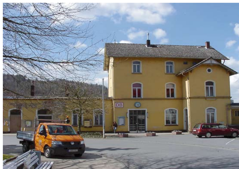
Auch der Bahnhofsvorplatz wird im Zuge der Umbaumaßnahmen neu gestaltet

Der Grund für den Haltestellen-Neubau ist die Neukonzeptionierung der Busfahrtrouten in der Kurstadt: Linienbusse werden künftig nicht mehr durch