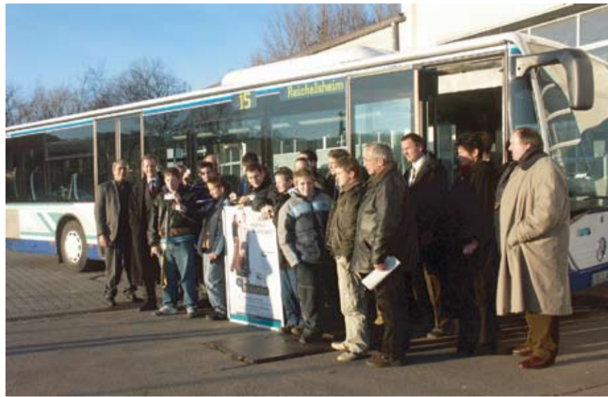
Nach Reichelsheim sollen auch in Höchst die Schulbusse mit Bus&Bahn-Begleitern besetzt werden

Zwei Odenwälder Schu- len sorgen mittlerweile für mehr Sicherheit auf der täglichen Fahrt zur Schule.